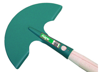
Dresse bordures demi-lune avec manche