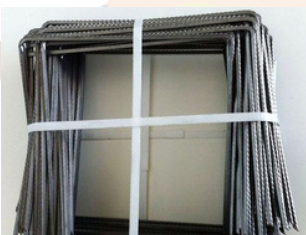
Agrafes pour toile de paillage - Ø4mm