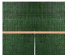
Collerette de paillage