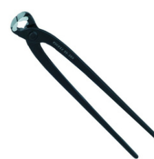
Tenaille russe - Longueur 25 cm